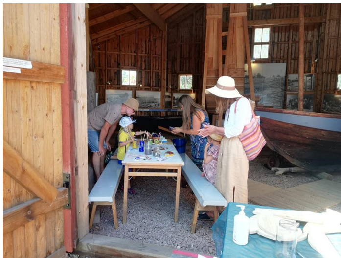
På Sjödagarna 2021